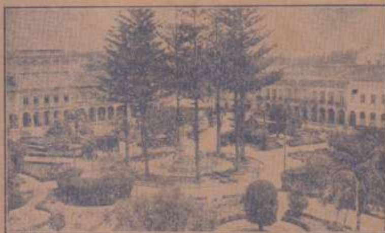
Cuenca. Parque «Abdón Calderón»