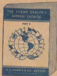
PAQUETES Y SURTIDOS PARA COMERCIANTES