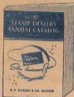
SERIES Y SUELTOS UNIVERSALES