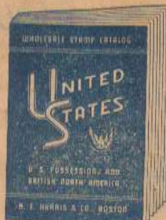
ESTADOS UNIDOS CANADA Y FERRANOVA