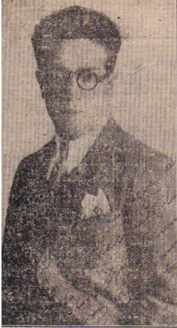
Sr. Dn. Jorge Montero Vela, Ministro de Comunicaciones,

quien, reconociendo la labor cultural que despliega nuestra publicación, se ha dignado prestarnos su decidido apoyo, por lo cual consignamos nuestro agradecimiento sincero.