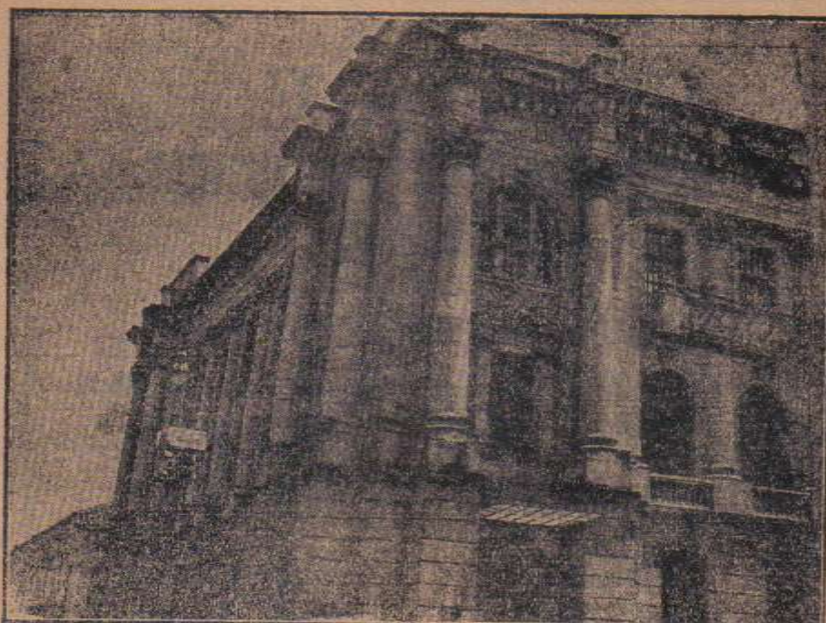
EDIFICIO DE CORREOS, donde tiene sus Oficinas la ASOCIACION FILATELICA ECUATORIANA