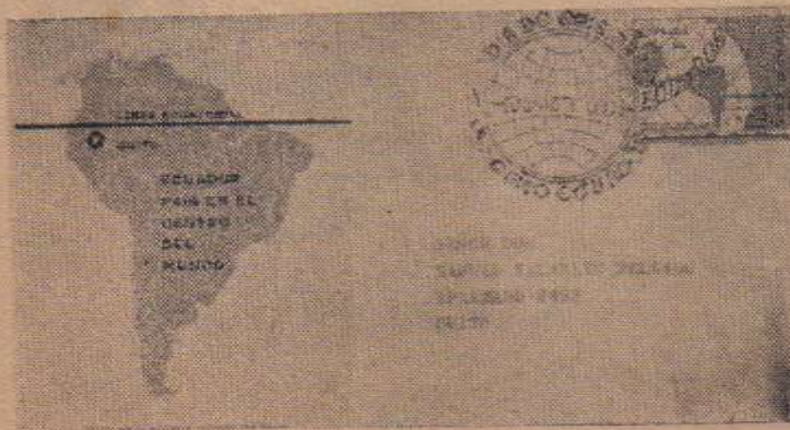
Sobre Primer Día de Emisión Monumento en el Cruce de la Carretera Panamericana y la Línea Equinoccial