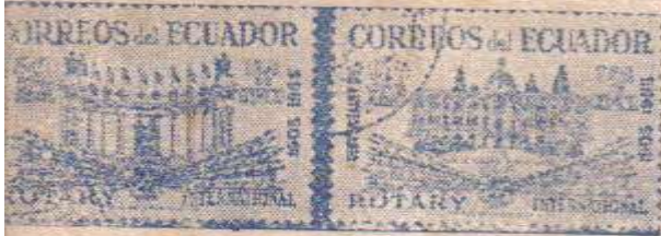
Hospital "Eugenio Espejo" - Quito