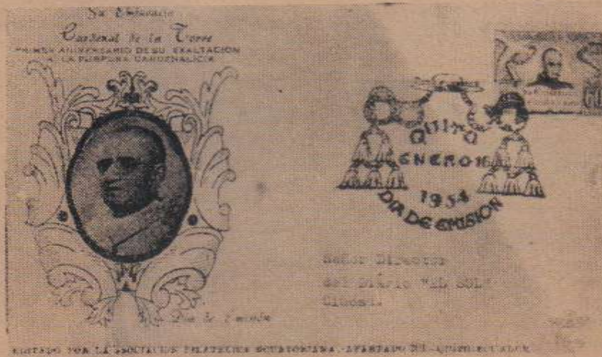
Sobre Primer Día de Emisión En Homenaje a Su Eminencia Cardenal Carlos María de la Torre