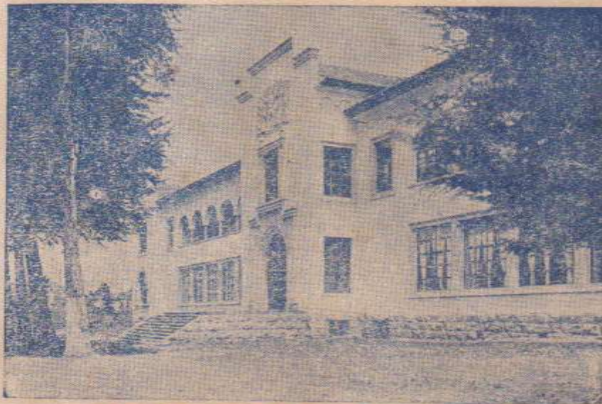
CASA DE LA CULTURA ECUATORIANA—QUITO

Sesquicentenario de la Independencia en Hispanoamérica