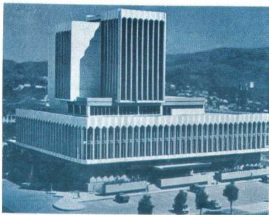
PROYECTO DEL PALACIO DE CORREOS EN QUITO

Frente a las crecientes demandas de servicio, la Dirección Nacional de Correos contará en el futuro con un edificio amplio y funcional.