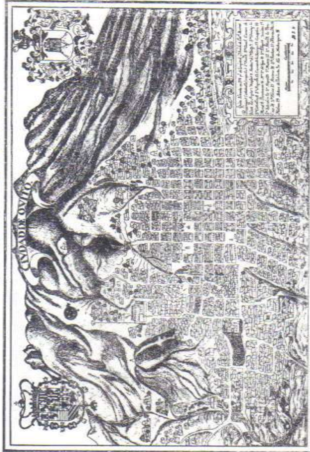
Plano de Quito, Siglo XVIII, Dionisio de Alcedo y Herrera EDITOR: APE. Emisión de 500 ejemplares.