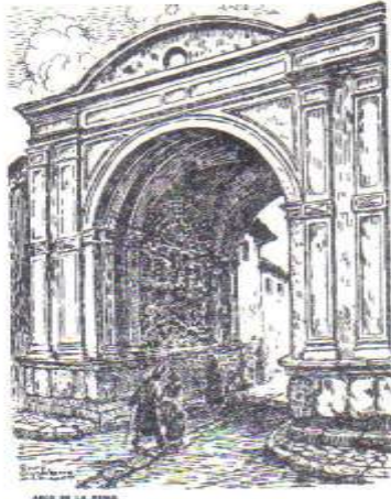
QUITO: El Arco de la Reina. J. M. Roura Oxandaberro, 1928 Editor: AFE - Impresor IGM - Emisión de 500 ejemplares Ejemplar