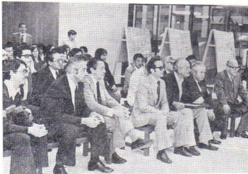
Escuchando el veredicto del Jurado Calificador.

EL COMITE ORGANIZADOR DE QUITEX'82, luego de estudiar y deliberar sobre los antecedentes de la IV EXPOSICION FILATELICA NACIONAL, y, tomando en consideración los méritos de los Señores Expositores, de los Miembros del Jurado Calificador, de las personas que han colaborado de manera decisiva con la Exposición, tanto en su organización, como en diversos aspectos de la misma, que han ayudado a la mejor realización de este extraordinario evento cultural, y, conociendo que es de elemental justicia reconocer la valía personal de todos los aquí mencionados, determina lo siguiente: