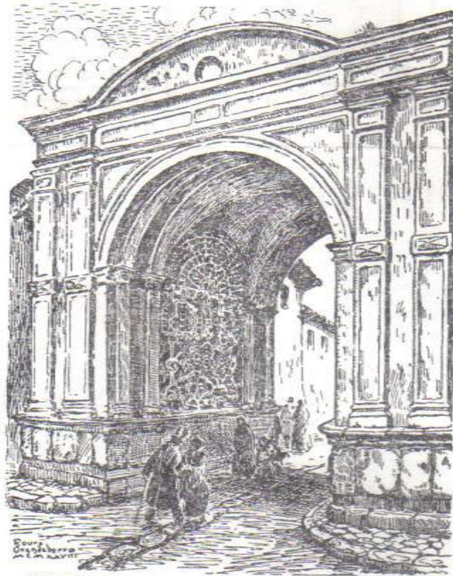
ARCO DE LA REINA