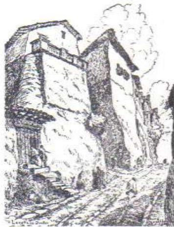
QUITO: La Casa del Doctor. J. M. Roura Oxandaberro, 1928 Editor: AFE - Impresor IGM - Emisión de 500 ejemplares Ejemplar

Sobres de Primer Día de Emisión (PDE) con la reproducción del "ARCO DE LA REINA" y de la "CASA DEL DOCTOR" respectivamente.