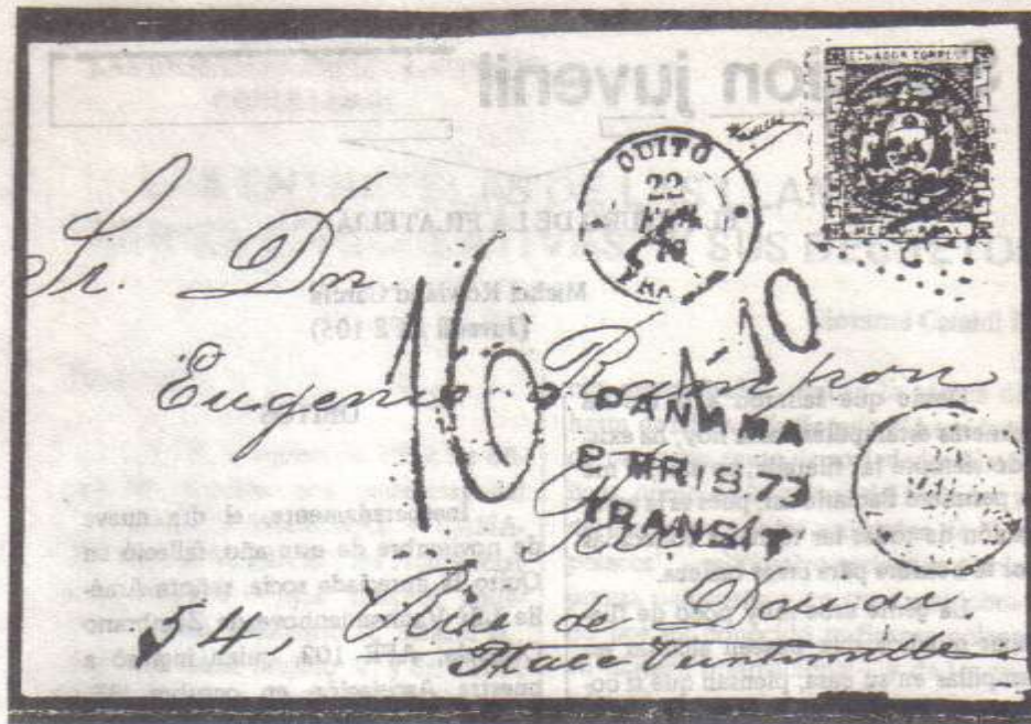
Figura 3: Sobre fechado el 22 de febrero de 1879, enviado a París, con un sello postal de medio real (Scott No. 9) el cancelador "3154" en azul. El medio real representa el pago del transporte terrestre hasta Guayaquil; la marca "T / 1-10" significa que el correo francés debía 1.10 francos a Gran Bretaña, por el transporte de una carta de peso sencillo; la marca marzo 8, 1879, es el paso por el istmo de Panamá; la fecha marzo 29, 1879, es la de llegada a Francia por Calais, vía barco británico; un impuesto de 16 décimas (1.60 francos), debía satisfacerse al recibo de la carta. (Numeral 9 del cuadro).