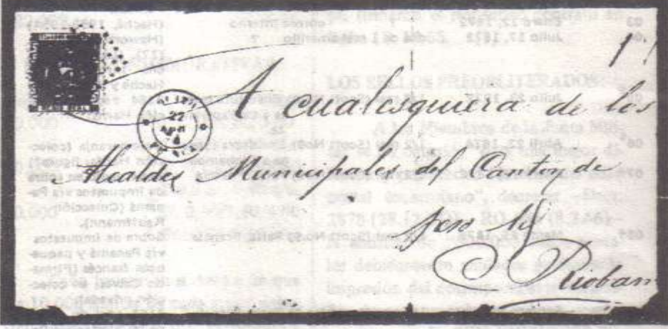
Figura 2: Envoltura de correo interno, fechado en abril 22 de 1874, con sellos postales de medio real (Scott No. 9) con el cancelador "3154". (Numeral 6 del cuadro; colección de Leo J. Harris).