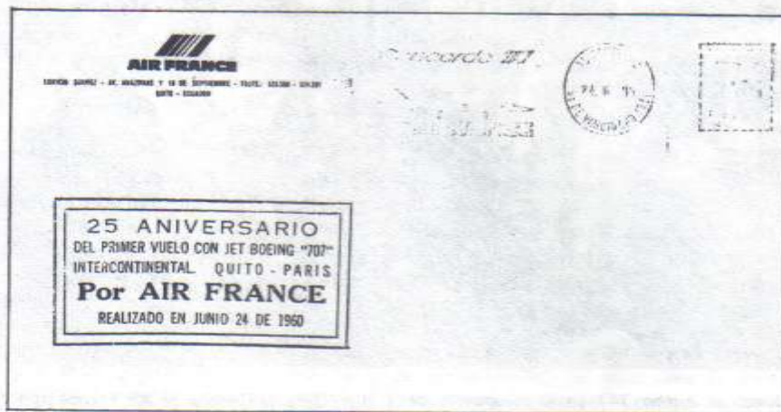
Anverso del sobre volado de París a Quito.

La Asociación Filatélica Ecuatoriana fue invitada a participar en la celebración y concurre al aeropuerto Mariscal Sucre de la Capital con un grupo de sus directores, que congratularon a la compañía por tan memorable fecha.