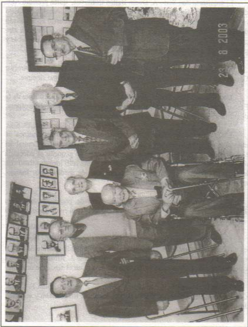
El grupo de expertos en el estudio de la contaminación del agua en el río Tago, en el mes de agosto de 2003.