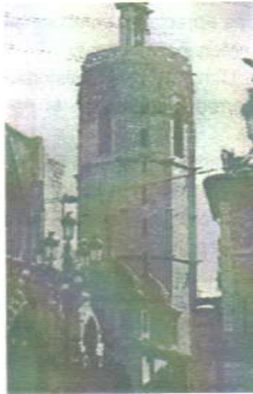
(Apreciamos en la ilustración la Torre del Miguelete y el Palacio de Exposición)