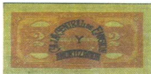
Resello "La Caja Central de Emisión y Amortización. Segunda Década del S. XX