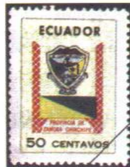
Gráfico 5: sello "Escudos provinciales" Año 1970. Catálogo BCE 1865