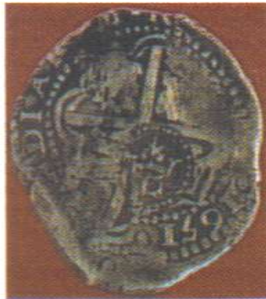
Moneda resellada. Ceca: Potosí. 1651 Valor facial 6 reales.

A partir de 1652 se normaliza la producción de la Casa de Moneda de Potosí, la principal proveedora para América Hispana, con un cambio importante pues se sustituye el blasón heráldico por unas columnas rematadas con la corona española y se agrega a todas las monedas la fecha de acuñación, manteniéndose todavía la factura a martillo.