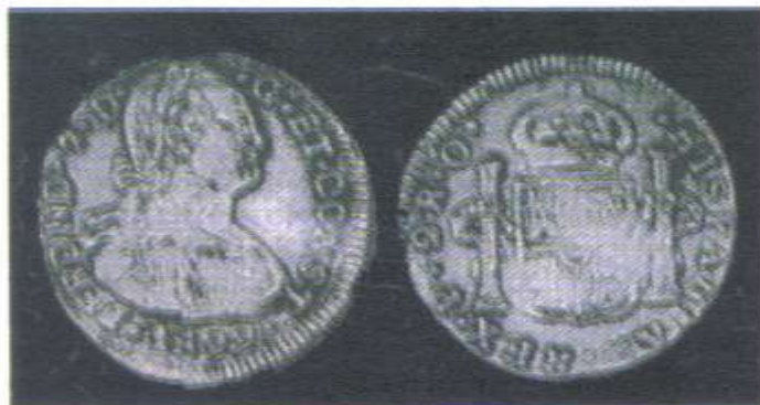
Moneda de 2 Reales acuñada en Pasto en 1822.

Este artículo tiene el objetivo de que los amables lectores juzguen si se tiene o no razón en designar a la moneda de Pasto como la primera acuñada en el Ecuador.