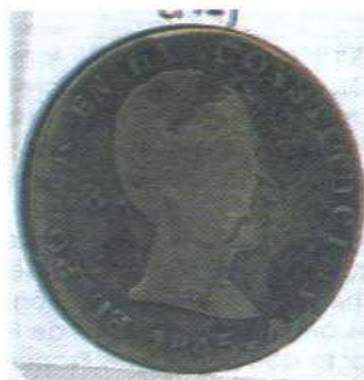
Predecimal quiteño. 8 reales 1845. Resello "P" invertida. Atribuido a la Policía

Los resellos y contramarcas son un reflejo de las realidades económicas de un contexto social y geográfico definido, su uso permitió encontrar una solución momentánea a un problema monetario, constituyéndose ahora en un vestigio material que enriquece la Numismática Ecuatoriana y la Americana.