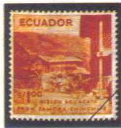
Gráfico 2: Sellos de la Gran Serie, Ecuador País de Turismo. Año 1955 Catálogo BCE 1283