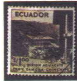
Gráfico 3: Sellos de la Gran Serie, Ecuador País de Turismo. Año 1955 Catálogo BCE 1284