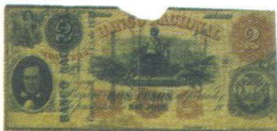
Resello Banco Nacional Guayaquil, marzo 1 de 1871 Accionistas Directores se lee la firma "Coronel M"

República Costarricense. Hoy en día esos billetes enriquecen la Historia Notafílica ecuatoriana pues permiten analizar y contextualizar una realidad económica motivada por la ausencia de una política monetaria coherente.