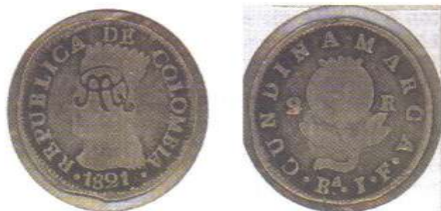
2 Reales plata. 1821 Ceca de Bogotá. Ba JF. Resello MdQ. Moneda de Quito