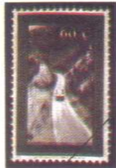
Gráfico 4: Sello "Carretera Loja Zamora" Año 1962. Catálogo BCE 1494