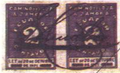
Gráfico 1: Sello "Camino de Loja a Zamora" año 1923. Catálogo BCE 424

Concurso Regional Filatélico, evento de primera categoría con participantes de las provincias del austro ecuatoriano, y jueces a nivel internacional; y, se lanza por primera vez en la historia filatélica nacional una emisión postal conmemorativa completa en homenaje al Cincuentenario de la Provincia de Zamora Chinchipe, y se lo hace en esta nuestra ciudad.