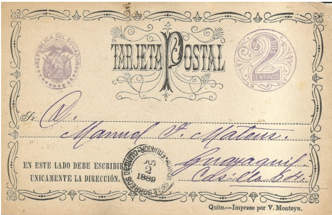
Lote 84: Tarjeta Montoya de dos centavos enviada de Quito a Guayaquil en 1889. Precio base US $ 40