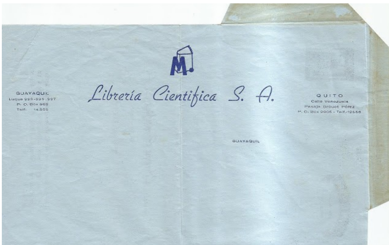
Lote 92: impresión para la Librería Científica en aerograma de 1957. Precio base US $ 50

Igual es el caso de uno de los aerogramas de 1957, que en el ejemplar que se ofrece incluye una impresión para uso de la Librería Científica.