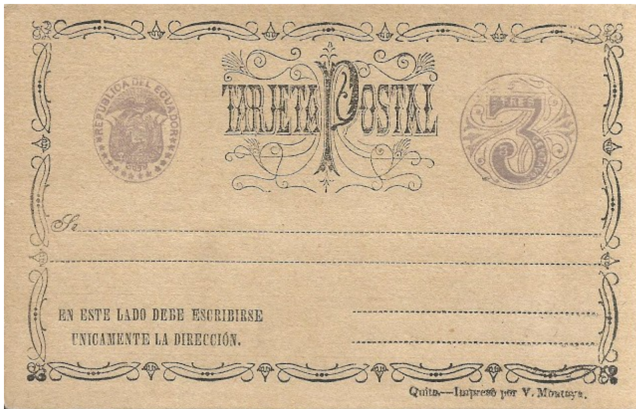
Lote 83: tarjeta tres centavos Montoya sin usar, en cartulina café. Precio base US $ 20

Tendrán a su disposición, por ejemplo, una tarjeta entero postal de tres centavos, de la emisión Montoya de 1884, en cartulina café gruesa, una de las variedades de papel de esta serie.