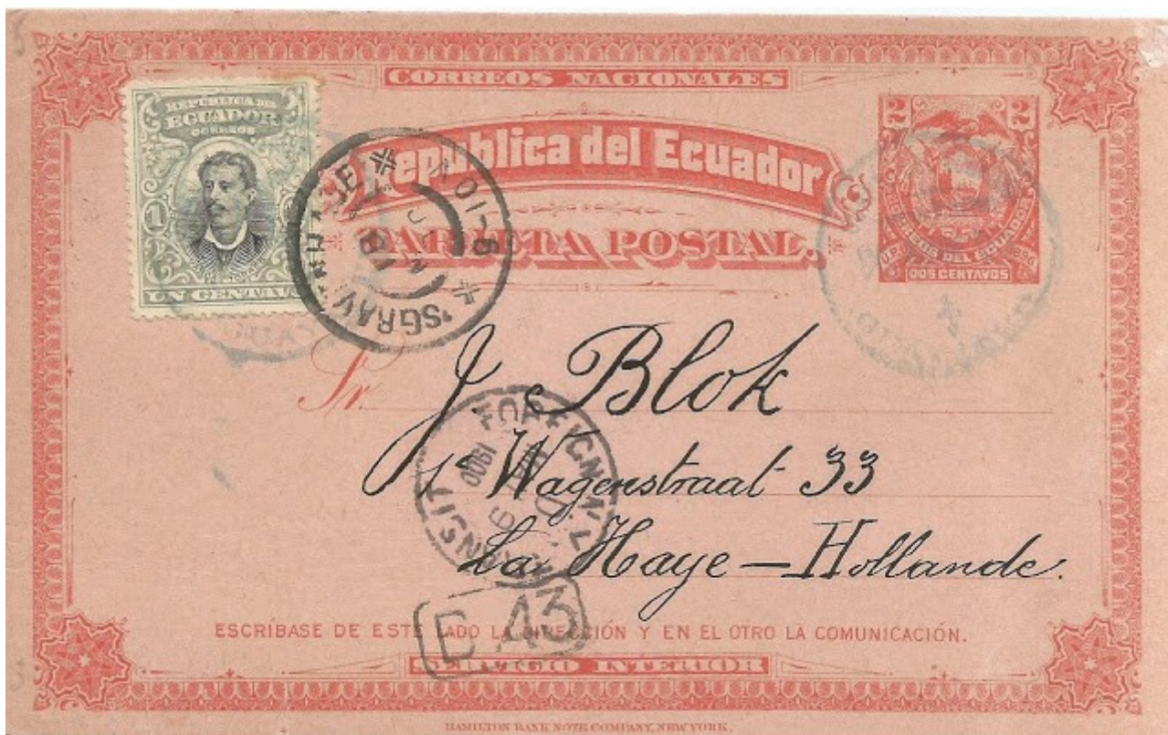
Lote 89: tarjeta entero postal de 1896 con franqueo adicional para completar la tarifa internacional. Precio base US $ 30

Una muy bonita tarjeta de dos centavos, de la serie Seebeck de 1896, franqueada con una estampilla para completar el franqueo internacional de tres centavos, es también parte de la dispersión.