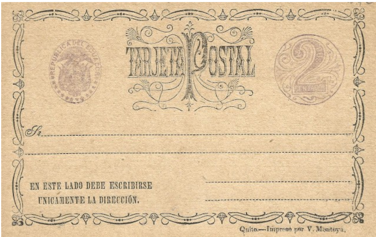
Tarjeta entero postal de dos centavos de la segunda emisión "Montoya" (1884), papel moreno, con grosor de 0,37 mm.

Las dos tarjetas de dos y tres centavos del año 1896 con el resello 1897-1898 en tamaño grande y pequeño y con una "Y" entre los años. A pesar de que esta revalidación nunca ha sido reportada en catálogos actuales, existen copias no solamente en estado nuevo, sino también debidamente circuladas. En cada caso el número existente no debe superar los cinco ejemplares.