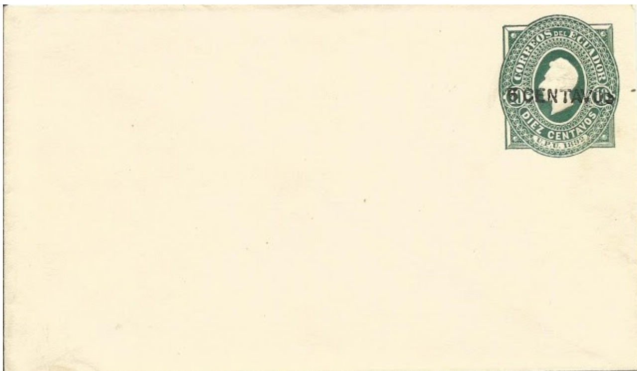
Sobre de la emisión de 1892, con resello "5 CENTAVOS", letras grandes, sin adornos, en papel crema

El sobre de diez centavos con la efigie de Sucre, emitido en 1892, resellado cinco centavos con letras grandes sin trazos de adorno. Este sobre existe en dos papeles diferentes; blanco y amarillo pálido o crema y es particularmente difícil de obtener en este último color. He visto cuatro ejemplares del papel blanco y uno en crema pero ninguno circulado.