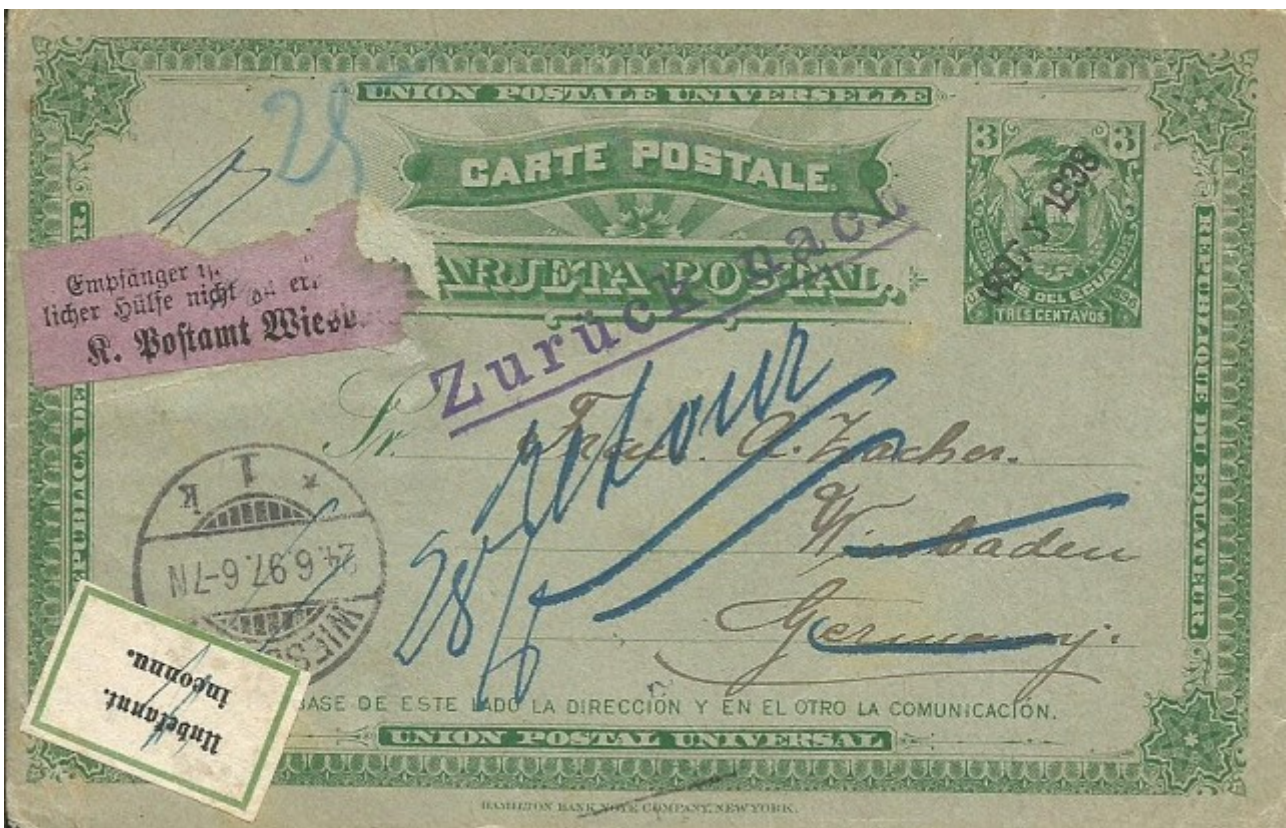
Tarjeta entero postal de 3 centavos de la emisión de 1896, con resello "1897 Y 1898", circulada

Las dos tarjetas de dos y tres centavos del año 1896 con el resello 1897-1898 en tamaño grande y pequeño y con una "Y" entre los años. A pesar de que esta revalidación nunca ha sido reportada en catálogos actuales, existen copias no solamente en estado nuevo, sino también debidamente circuladas. En cada caso el número existente no debe superar los cinco ejemplares.