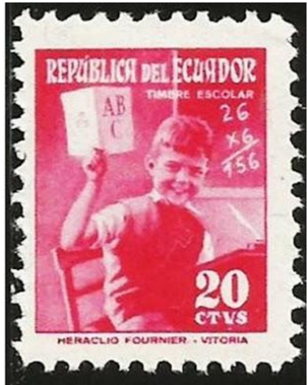
El diseño de Sánchez-Toda que se utilizó para imprimir el Timbre Escolar de 1954, derecha

Para el Timbre Patriótico y Sanitario , Sánchez-Toda propuso un sello azul, en el que aparece una estatua de Esculapio y, al fondo, la bandera ecuatoriana. La nota a lápiz en la parte superior derecha del boceto, da cuenta de la no aceptación del diseño y la indicación del que debía usarse: "Jura bandera Col. Militar". No es posible saber si la nota se refería a otro diseño que también había sido presentado, o si se indicaba que se elabore una nueva propuesta. En todo caso, la estampilla que finalmente se puso en circulación es, precisamente, la azul con la imagen de un cadete en el acto de jurar la bandera (Scott RA75), y tiene un error que no aparece en el diseño de Sánchez-Toda: en la parte superior aparece la leyenda Correos del Ecuador , en lugar de la correcta, República del Ecuador , pues el Timbre Patriótico no era de naturaleza postal, sino fiscal. En 1957, cuando se hizo una nueva emisión con el mismo diseño, el error fue corregido (Scott RA77).