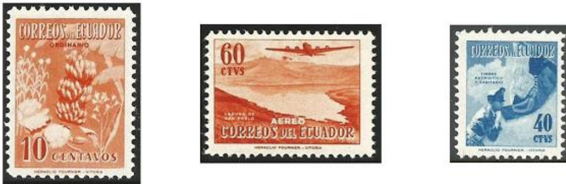
Los diseños de Sánchez-Toda, arriba, y los sellos efectivamente emitidos

Conforme los bocetos firmados por Sánchez-Toda, que aquí presentamos, fue él quien realizó los diseños originales para las series de correo ordinario y aéreo, para el Timbre Patriótico y Sanitario y para el Timbre Escolar . Solo el diseño de este último corresponde a la estampilla finalmente emitida; en el caso de los otros tres, la imagen utilizada fue diferente y no sabemos si fue diseñada también por Sánchez-Toda.