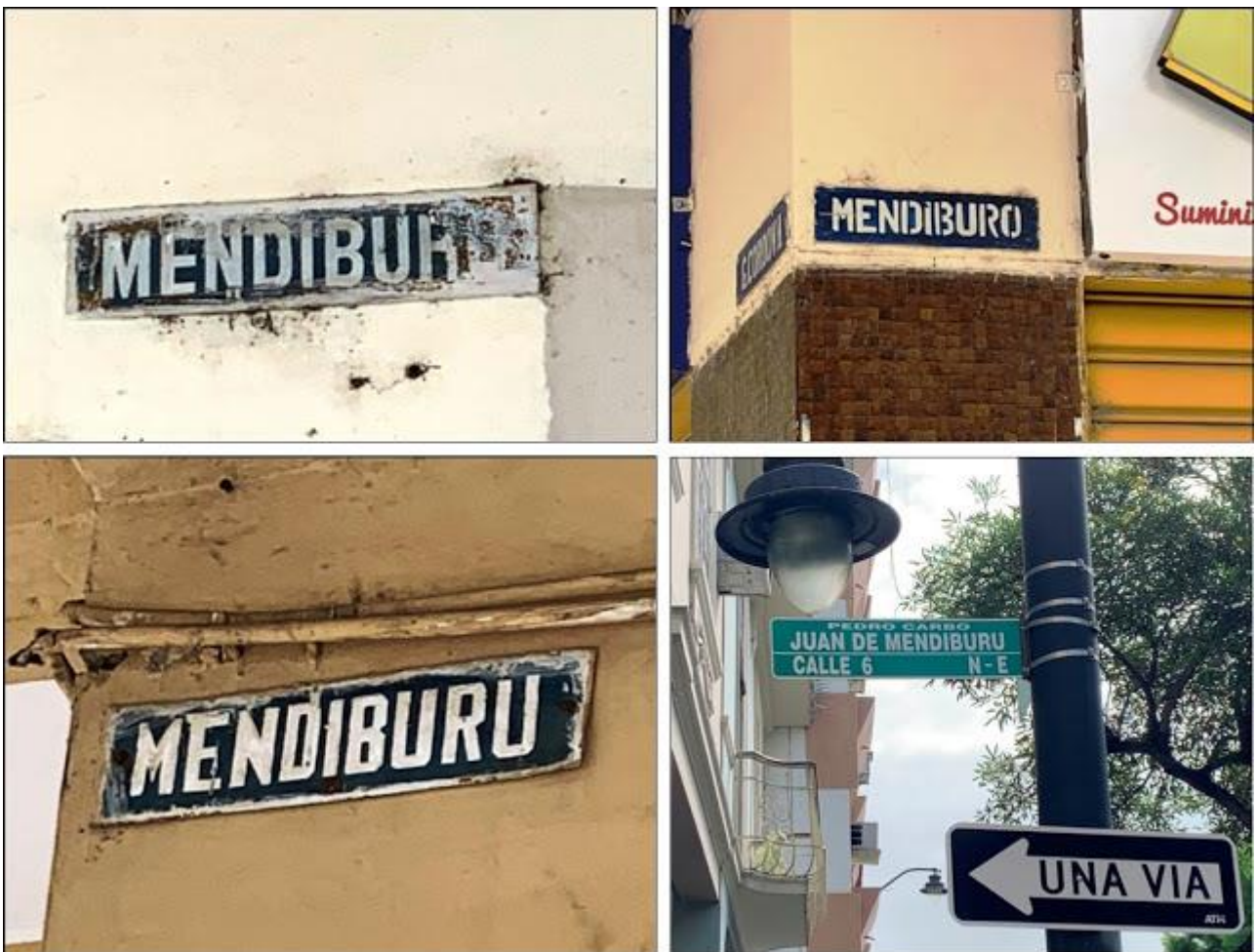
Varios letreros, de distintas épocas, en las esquinas de la calle Mendiburu

Tenía curiosidad sobre como era la situación de la señalización de la calle Mendiburu, así que con celular en mano, y con bastante respeto al barrio que conozco muy bien tomé las siguientes fotos y me pude dar cuenta que en la señalización antigua hay rótulos con Mendiburo, y también con Mendiburu. Pero que en la señalización mas moderna, que es la última que colocó en las esquinas el Municipio de Guayaqui, consta con toda claridad el nombre completo y correcto de esta calle JUAN DE MENDIBURU, como puede verse en las siguientes fotos. En conclusión en base a esta señalización puede decirse que si bien la mayoría de los guayaquileños nos referimos a esta calle como Mendiburo, al menos en el departamento de señalética lo tienen bien claro que el nombre correcto es Juan de Mendiburu, y en la nomenclatura moderna corresponde a la Calle 6 del cuadrante N-E, nomenclatura que por cierto nadie usa ni hace caso.