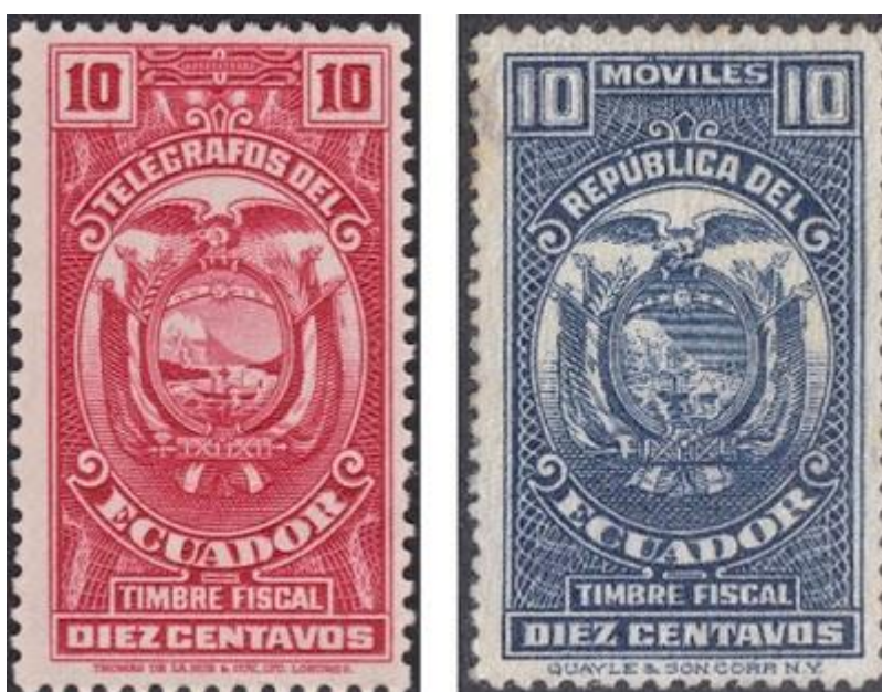
Los timbres telegráfico de Thomas de la Rue y Fiscal móvil de Quayle & Son, con la identificación de la casa impresora al pie

Conviene referirse también a los dentados: 12 en los de American, 14 en Perkins y 12 1/2 en Columbian. Los timbres de esta última casa impresora son, además, ligeramente más anchos (unos 2 mm.) que los otros.