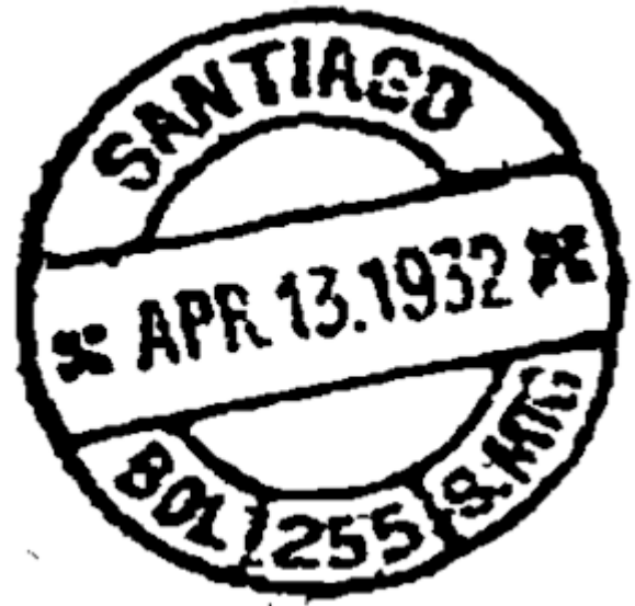
Imágenes 5 y 6.- Baquerizo Moreno, matasellos 221 (Galápagos), con diseño propio (tomado de T.G.Dodd, Galapagos Islands - A Philatelic Study , p. 19. A la derecha, matasellos tipo B

El de Tipococha, en la provincia de Cañar (258) es el último que estamos seguros que era del tipo B, pero no hemos visto los matasellos siguientes. El número 270, de Pimampiro, en la provincia de Imbabura, aparece ya con un nuevo diseño, que clasificamos como C (imagen 7). Los canceladores metálicos fueron reemplazados por gomígrafos con un doble círculo de 31 mm. de diámetro, que ya no eran fechadores. El doble círculo aparece solo como dos segmentos, uno superior con la palabra CORREOS y uno inferior dividido en tres espacios como en los matasellos anteriores, y con el mismo contenido. Entre los dos fragmentos consta el nombre de la oficina.