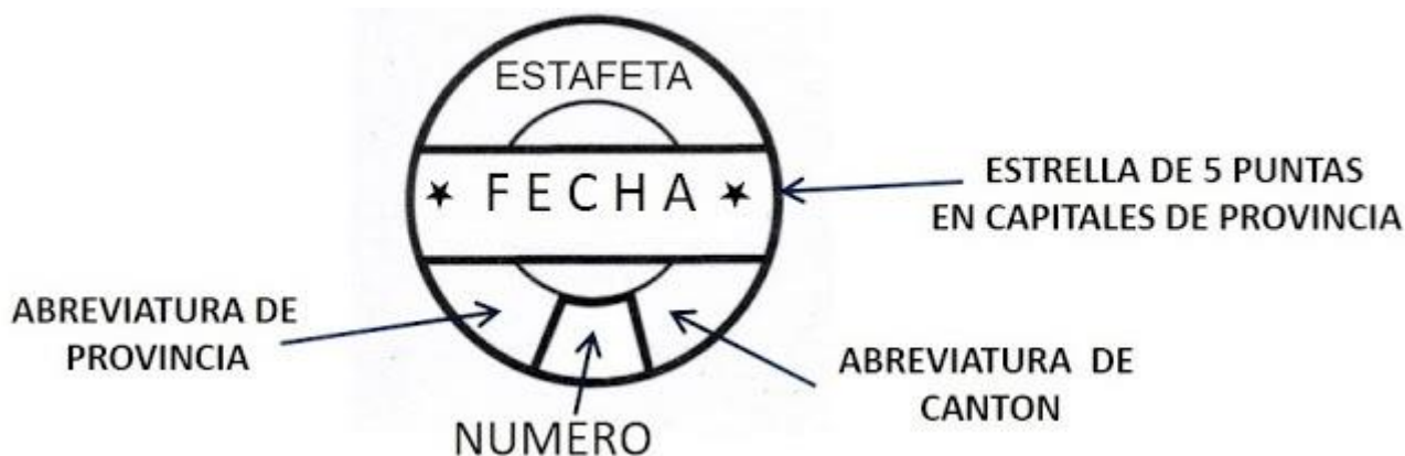
Imagen 2.- Diseño básico de los matasellos iiciales tipo A

Aunque se aplicaron generalmente en color negro, también hay casos en que aparecen en colores violeta, rojo o verde.