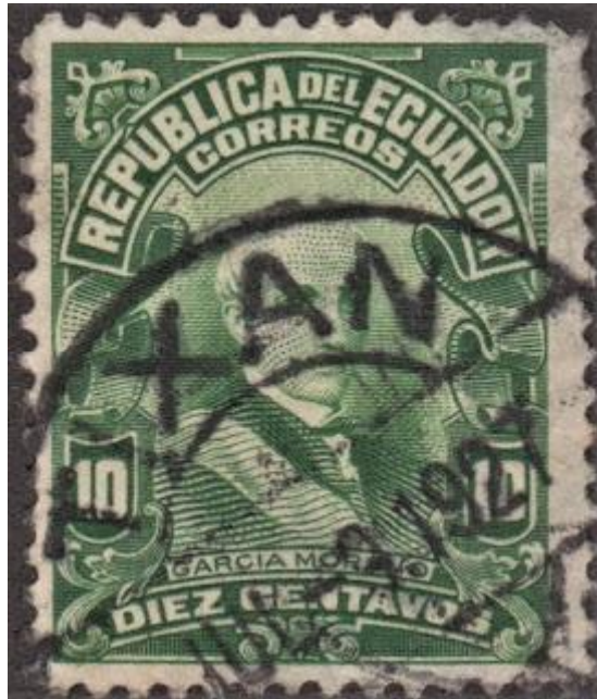
Imagen 1.- Tixán, uso más antiguo conocido