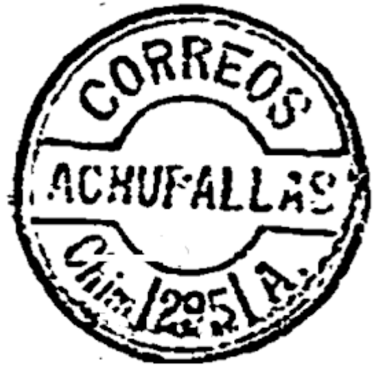
Imágenes 7 y 8.- Matasellos tipo C (izquierda) y D

Hay casos en que, manteniendo el número de la oficina y la identificación de provincia y cantón, se utilizaron matasellos con diferencias en el diseño que reemplazaron a los originales, seguramente porque estos últimos se perdieron o quedaron inutilizados.