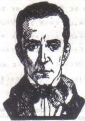
- DR. JOSÉ JOAQUÍN DE OLMEDO -

SU INCREÍBLE CAPACIDAD INTELECTUAL Y SU DE - DICACIÓN ADMINISTRATIVA EN LOS HECHOS POLÍ - TICOS QUE LE TOCÓ AFRONTAR CON TAL VALOR Y ACIERTO, HICIERON DE ÉL UNA FIGURA BRILLANTE - E INSIGNE PARA LA HISTORIA ECUATORIANA. AL - CUMPLIRSE 200 AÑOS DE SU NACIMIENTO, EL 19 DE MARZO DE 1980, NUESTRO GOBIERNO DECLARA A ES - TE EL AÑO JUBILAR DE OLMEDO, CONMEMORÁNDOLO CON LA EMISIÓN DE TRES ESTAMPILLAS Y LA ACU - ÑACIÓN DE UNA MONEDA CON SU EFIGIE. EN ESTA HIDALGA CIUDAD, QUE A PESAR DE SU - TRANSFORMACIÓN MODERNA, VIVE TAN LLENA DE SUS RECUERDOS, SE HA FUNDADO EL INSTITUTO OLMEDIA - NO DEL ECUADOR, PRESIDÉNDOLO EL DR. ABEL RO - MEO CASTILLO.