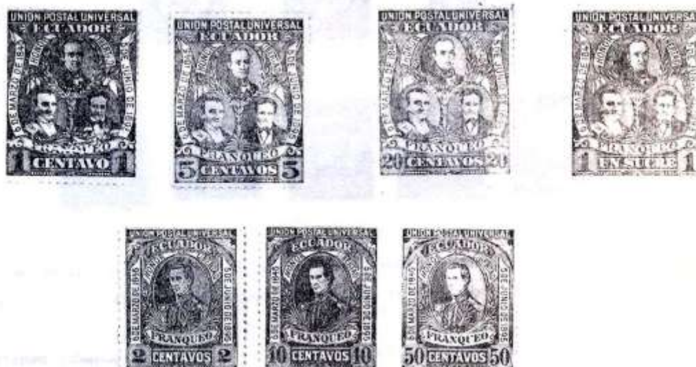
LOS PRIMEROS SELLOS CONMEMORATIVOS DEL ECUADOR.

Las estampillas de 1895 y sobrantes de 1896 fueron preparadas para devolverlas a Seebeck de acuerdo con el contrato, una vez abrogado por el General Eloy Alfaro, pero parece que esto no llegó a efectuarse, pues Valenzuela Reina, contratista de la serie conmemorativa del triunfo del Liberalismo en el país, obtuvo que se le entregue los stocks a mano como compensación del costo de la nueva emisión que él contratara en Alemania (nefasto procedimiento) y de esta manera no se mejoró en modo alguno la política filatélica con el nuevo régimen.