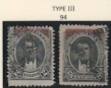
TYPE III 94