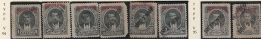
T Y P E V 94