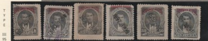
T Y P E III 95