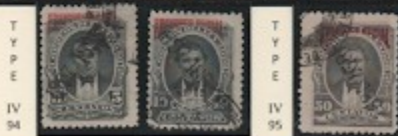
T Y P E IV 94