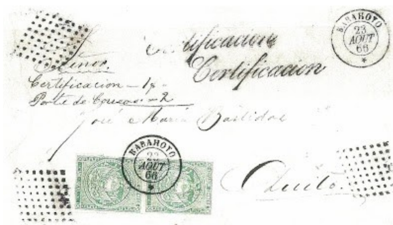
Carta privada enviada desde BABAHOYO 1866 hacia Quito, con pareja vertical de un real verde y cancelado en Esmeraldas 1866, se usó además la marca Certificación.