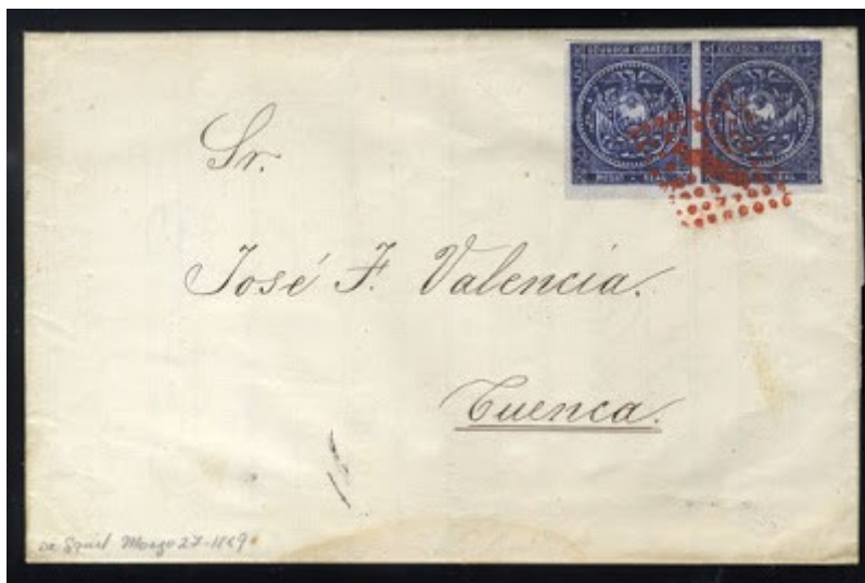
Carta privada enviada desde Guayaquil 1869 hacia Cuenca, con pareja de medio real azul, cancelado con sello FRANCA en color rojo.