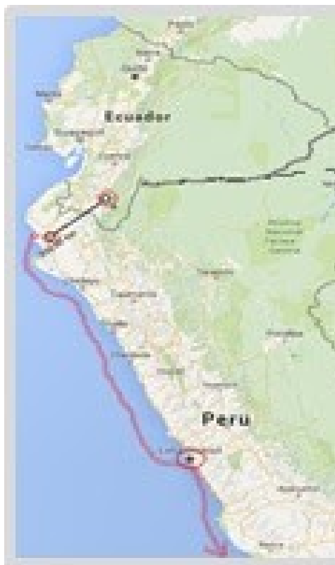
Ruta Loja-Piura-Payta-Lima o Valparaíso

Durante los 8 años y 8 meses que estuvo en circulación la primera emisión de sellos ecuatorianos: “Emisión escuditos Rivadeneira”, se encuentran diversos tipos de sobres enviados al exterior tanto por razones comerciales de negocios como por razones privadas de simple comunicación, debido al tiempo transcurrido hasta el día de hoy, julio del 2017, los mismos son muy escasos y difíciles de conseguir.