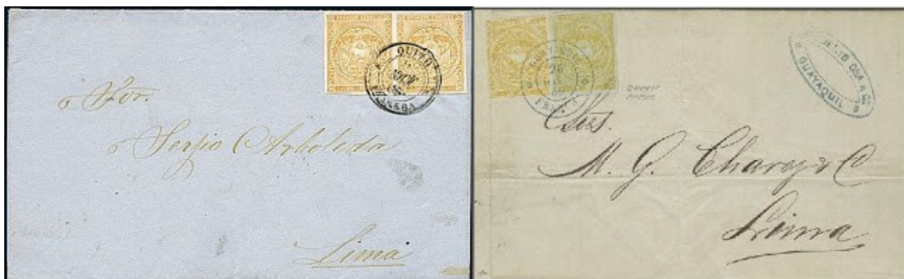
Privado y Comercial

Durante los 8 años y 8 meses que estuvo en circulación la primera emisión de sellos ecuatorianos: “Emisión escuditos Rivadeneira”, se encuentran diversos tipos de sobres enviados al exterior tanto por razones comerciales de negocios como por razones privadas de simple comunicación, debido al tiempo transcurrido hasta el día de hoy, julio del 2017, los mismos son muy escasos y difíciles de conseguir.