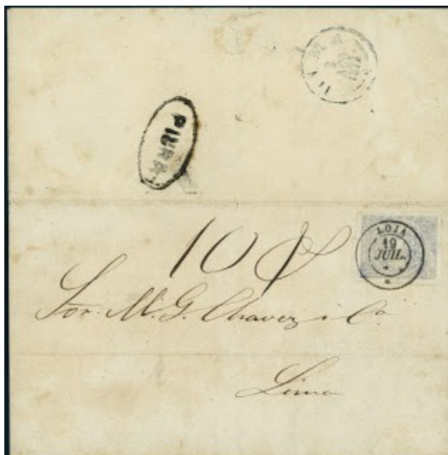
Medio real azul "Sobre PIURA" a Lima.

La mayoría de sobres encontrados en estos hallazgos pagan tarifa que va desde los 2 reales hasta los 8 reales dependiendo del peso de la carta, un factor muy poco estudiado debido a la extrema rareza del material han sido los sobres trasladados por vía terrestre a los países del sur del continente, se trata de sobres enviados desde la ciudad sureña de Loja, los mismos atravesaban raudos la línea fronteriza ingresando al Perú por la ruta Loja-Piura, y posteriormente tomaban buque en el puerto de Payta para llegar a Callao-Lima en el caso de un sobre encontrado, y por la misma ruta hasta Valparaiso, en el caso del segundo sobre conocido.