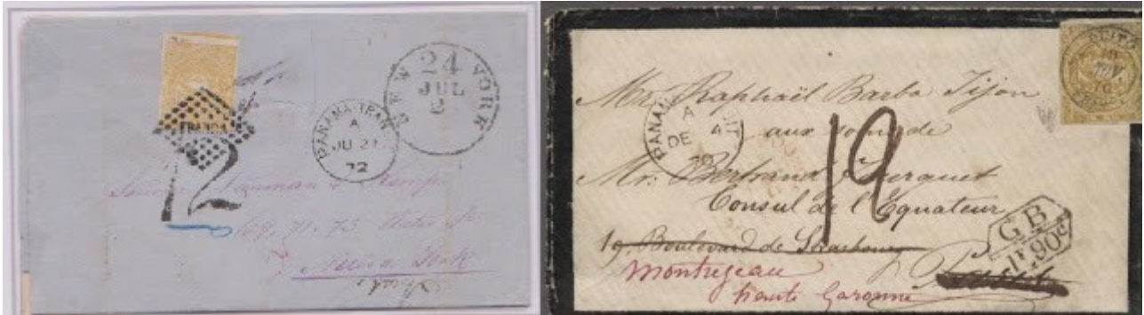
Lanman y Barba-Jijón

El hallazgo Lanman & Kemp para sobres salidos al norte del país, concretamente a USA, y; en lo relacionado a Europa, los sobres guardados por el Cónsul del Ecuador en París en ese entonces, Rafael Barba Jijón y por su familia, se puede considerar como otro importante hallazgo, esto en relación al material conservado de manera conjunta, otros hallazgos de sobres en grupo del periodo clásico ecuatoriano en el exterior casi no se conocen.