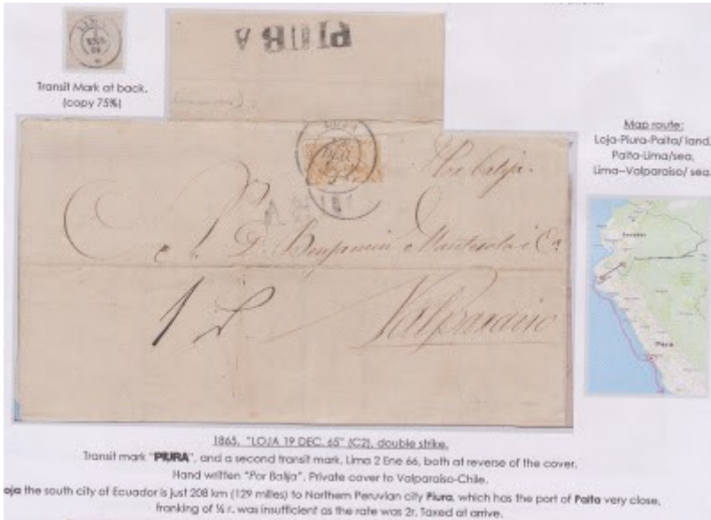
Un real amarillo bisectado "Sobre PIURA" a Valparaiso.

De esta manera, analizando los sobres, se ha podido ir reconstruyendo la Historia Postal Marítima del país, admirando el desorden en el pago, a veces con 2 sellos de un real verde, a veces con 2 sellos de un real amarillo, a veces bisectando sellos de 4 reales, o bisectando el sello amarillo, o con sello suelto de medio real, inclusive existe un sobre con un sello de un real verde junto a un real amarillo.