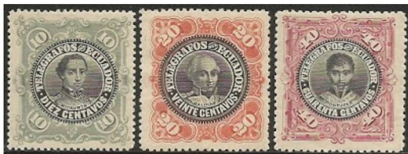
La serie de timbres telegráficos de 1899

Luego de cinco años de utilizar resellos y timbres cuya validez había terminado, el Ecuador volvió a ordenar una serie de timbres telegráficos, esta vez a la casa Waterlow & Sons Ltd., de Londres, que se había convertido por esos años en el proveedor de especies valoradas para el gobierno.