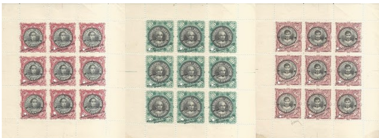
Mini pliegos con las pruebas de color de la serie de timbres telegráficos de 1899

A partir de 1900, y durante la década siguiente, el servicio telegráfico dejó de usar timbres y los reemplazó por fórmulas telegráficas, documentos en los que el usuario escribía el mensaje y que tenían el timbre preimpreso.