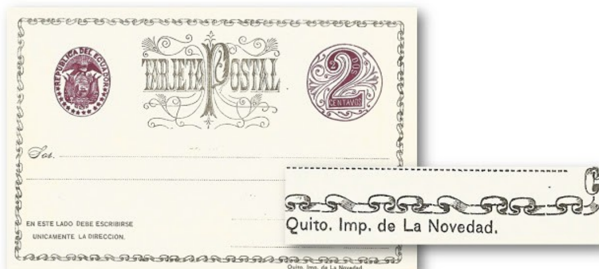
Tarjeta entero postal de dos centavos, primer emisión ecuatoriana impresa en La Novedad

Hasta hoy no se conoce autorización oficial ni documento alguno que permita establecer los detalles de esta emisión, que usó como modelo las primeras tarjetas que se pusieron en circulación en Uruguay, en 1878. Solo sabemos, por la inscripción al pie de las tarjetas, que fueron impresas en Quito, en la Imprenta de la Novedad .