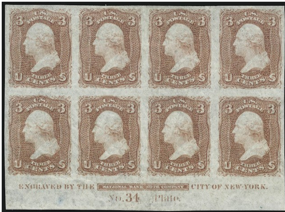
Ensayo de plancha

Pueden ser aprobados o no. Los sellos clásicos alcanzan alto valor.