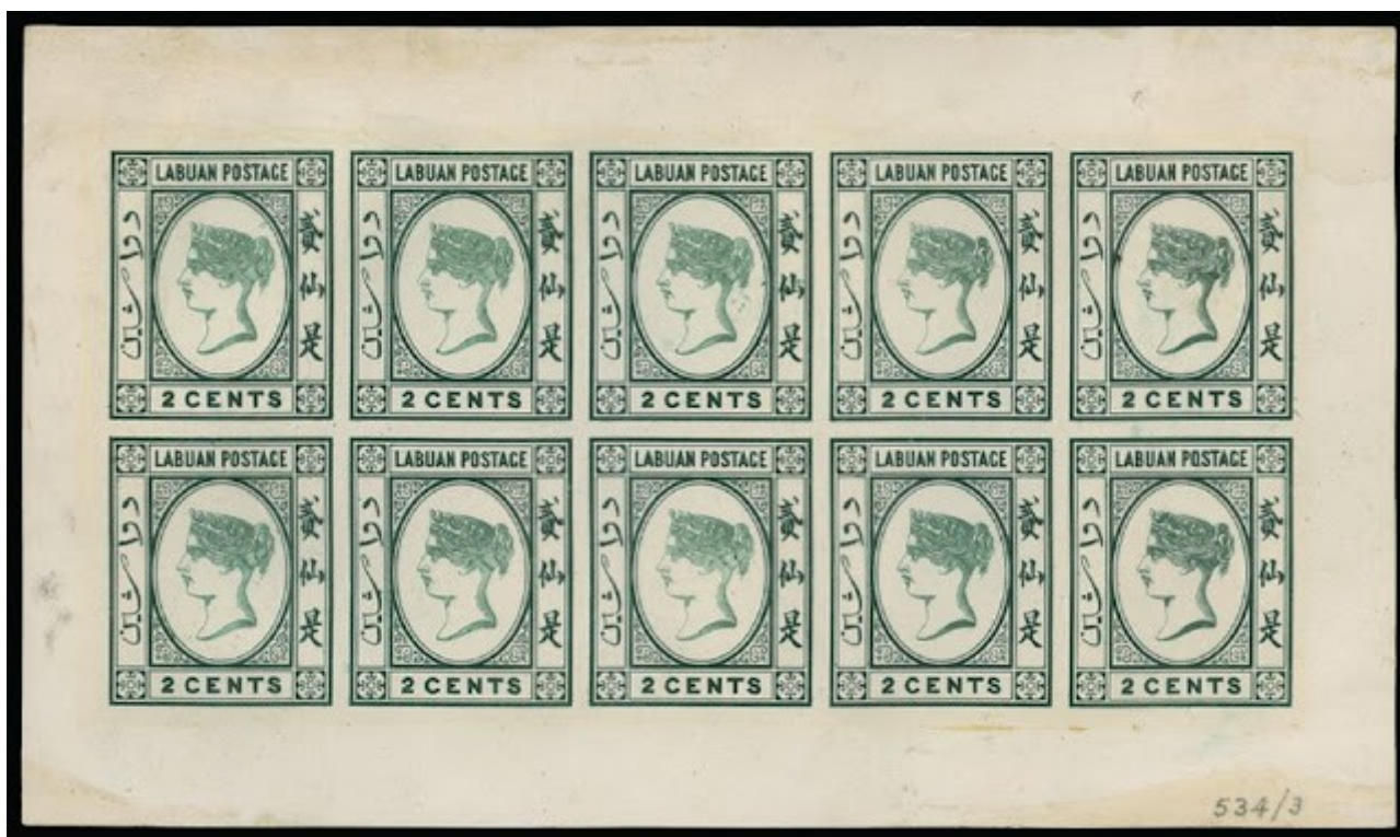
Labuán, 1879. Ensayo de plancha

Los Ensayos pueden imprimirse tanto en papel como en cartulina, y pueden llevar éstos cualquier inscripción, ya sea al dorso como al frente del sello. Esto es a excepción de sobrecargas de origen oficial. Los ensayos sobre papel muestra no dejan de serlo (esto es válido para los cuatro para muestras citados en Kn. 1958 -inscripción al dorso).