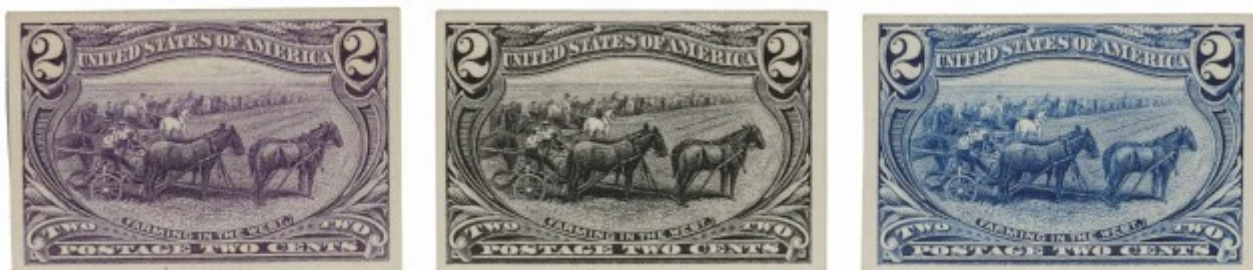
Ensayos de color

Se imprimen para probar la calidad y comportamiento de diferentes procedencias de tintas a fin de elegir la más adecuada. También sirven para confirmar el color o los colores definitivos. Estos ensayos darán algunos con el color adoptado. En este caso se podrían confundir con un sello sin dentar. Para evitar esto NO se usa papel de estampillas. Los sellos clásicos alcanzan alto valor.