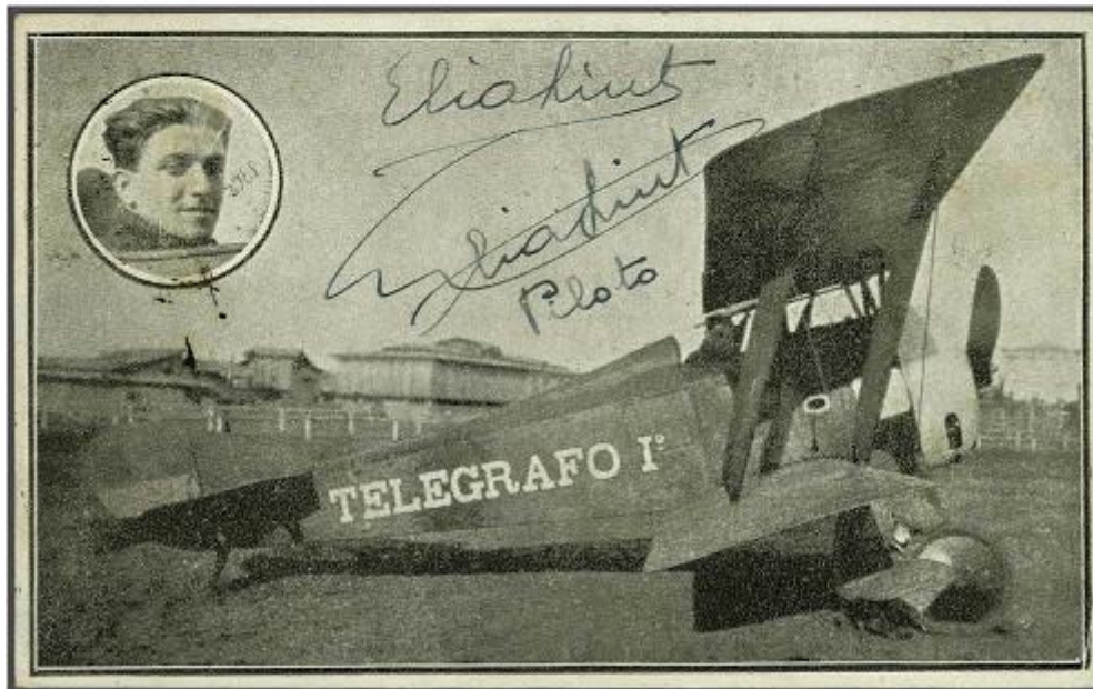
Una de las tarjetas postales transportadas por Elia Liut en el primer vuelo postal ecuatoriano.

En la imagen, Liut en el medallón de la esquina superior izquierda y el Telégrafo I, un Macchi Hanriot HD1.