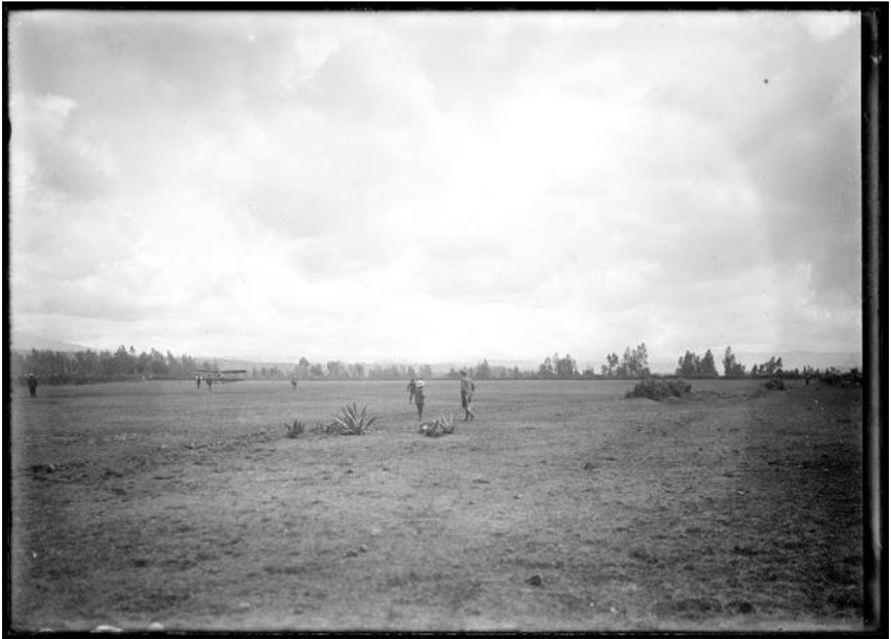
El Telégrafo I aterriza en Cuenca

De inmediato encontró espesas nubes pero esta vez estaba decidido a no rendirse, así que intentó pasar en medio de ellas; cuando su experiencia le advirtió del peligro, empezó a ganar cuota en vertical dando amplias vueltas sin acercarse a las montañas. Buscaba no perder la orientación y de cuando en cuando se limpiaba los lentes cubiertos de gotas de agua, teniendo la mirada fija hacia adelante. Se preguntó hasta cuándo el moto resistiría dando potencia y el aparato soportaría el esfuerzo de tantas vibraciones. Contó más tarde que un cóndor lo había acompañado por algunos tramos del vuelo y, de pronto, pasando entre dos cimas nevadas, vio el declive bajar al valle y comprendió que estaba al otro lado de la cordillera. Redujo e inmediato las revoluciones del motor, se estiró de hombres y dio gracias a su ángel de la guarda. Era hombre de suerte y lo sabía.