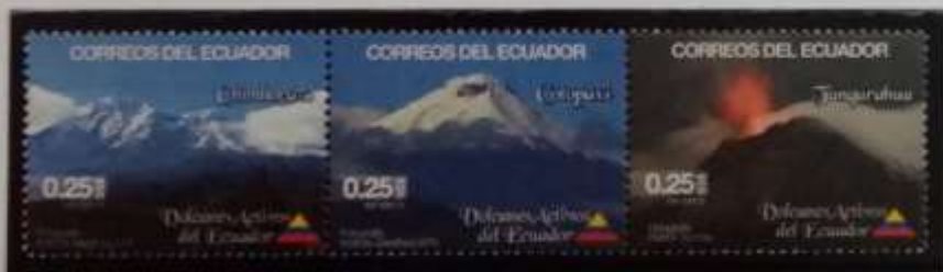
Altar (5319 m.) Chimborazo (6310 m.) Carhuarazo (5046 m.) Altar (5319 m.) Cerro Cubillin (4719 m.) Montagne dell' Ecuador