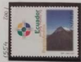
Volcano Sangay (5300m.)