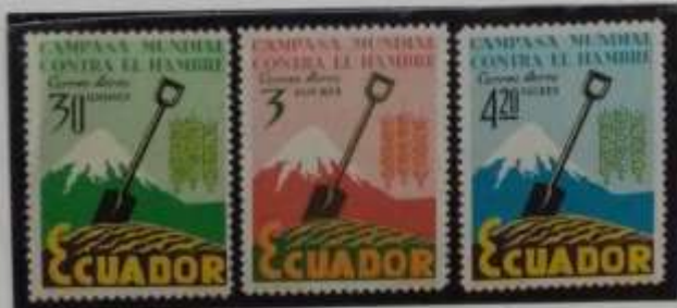
Monte Chimborazo 6310 mt.