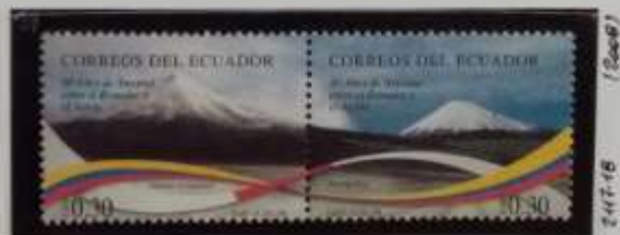
Sulla vetta del Cotopaxi