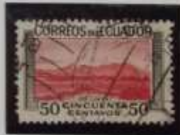
Volcano Illiniza (5248m.)