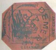
Guayana británica, 1856: el único ejemplar conocido del sello de un céntimo impreso en papel rojo con una prensa manual (abajo) del Sunday Chronicle.

El título de «sello más raro del mundo» se reconoce universalmente a un cent , de color rojo magenta, emitido por la Guayana británica en 1856.