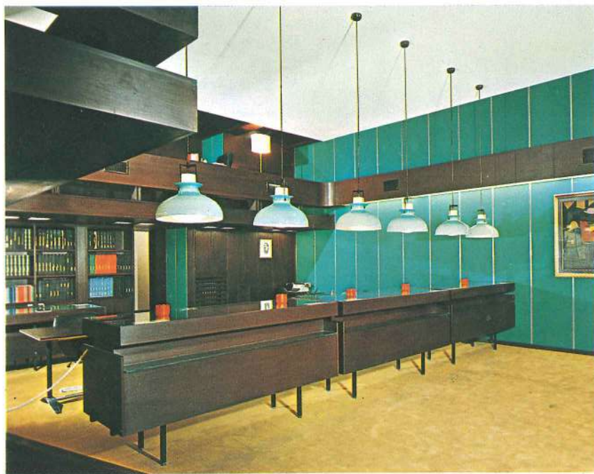
La sala de ventas de la filial en Turín de la firma Alberto Bolaffi, situada en la céntrica vía Roma.

De modo que vamos a hablar de esa clase de tiendas. En la actualidad existen en casi todas las ciudades y van desde la modesta, atendida por su propietario y algún miembro de la familia, hasta la firma importante con distintas sucursales y con decenas o centenares de dependientes. La elección de la