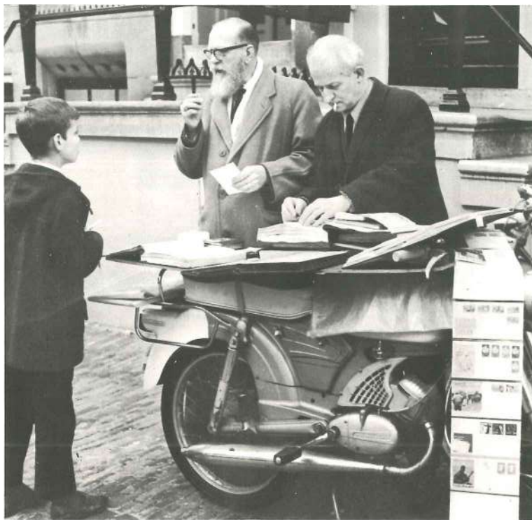
También los mercadillos de objetos usados, en las grandes ciudades, tienen su «sección filatélica». En Roma, Madrid, París, Milán, existen verdaderos mercadillos semanales que se realizan al aire libre y están exclusivamente reservados a los sellos. Esta fotografía fue obtenida en una calle de La Haya, en Holanda.

Ya sea que se efectúen las adquisiciones en forma personal o bien se hagan por correspondencia, es útil preparar, al efecto, una «lista de