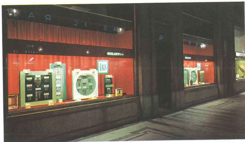
Los escaparates de la filial Bolaffi de Turin. El comercio filatélico ya dispone de una red muy amplia de distribución de tiendas para la venta de sellos de colección, que incluso se encuentran en las ciudades de provincia.