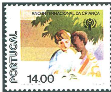
Emisión portuguesa realizada en el Año Internacional de la Infancia.

uno de los primeros en cobrar protagonismo fueron los dedicados a la infancia y la juventud. Los mensajes y peticiones de los primeros sellos dedicados a los más jóvenes, emitidos a principios de siglo, estaban destinados a paliar la desesperación y la desgracia. A medida que avanzaba el siglo y las condiciones sociales mejoraban, las peticiones cambiaron. Hoy en día, se reclaman los derechos del niño, derechos que en cada país revisten distintas características