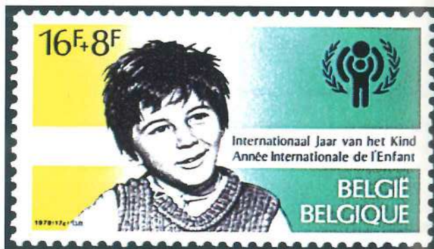
Sello de Bélgica emitido en el Año Internacional de la Infancia.

presta atención periódicamente a los niños con emisiones especiales. Bélgica y Holanda son los países que tienen mayor número de series ilustradas con niños. Italia y de nuevo Holanda son los que han reproducido un mayor número de diseños infantiles. Son muchos los países que no sólo piden apoyo a la infancia, sino que también dedican sus sellos a ella, abundando los juegos, las fábulas, los cuentos y los cómics como ilustraciones.