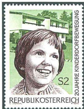
Emisión realizada en el vigésimo aniversario de la asociación de aldeas infantiles austríacas (1969).

Cuando las administraciones postales abandonaron las rutinarias series dedicadas a los escudos del país y a sus mandatarios, iniciaron las series de carácter conmemorativo. En un principio, esta producción filatélica se centró en los motivos nacionales (monumentos, costumbres...), pero pronto aparecieron las primeras series de carácter social y benéfico, unas con sobretasa y otras sin ella, destinadas sobre todo a los perjudicados de las guerras. Poco a poco, los motivos se fueron perfilando, y