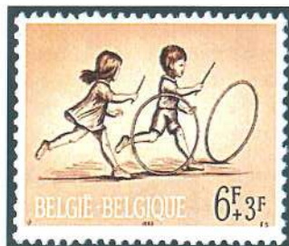
Serie belga dedicada a los juegos infantiles (1966).