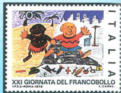
Sellos ganadores de los concursos de diseño infantil promovidos por la administración postal italiana (1979) y española (1989).