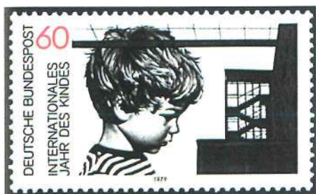
Sello de la Alemania Federal emitido en el Año Internacional de la Infancia (1979).

(mientras en unos países hay que mitigar el hambre, en otros se piden colonias de vacaciones). De hecho, una colección dedicada a los niños montada por países es una radiografía de la realidad social de cada país.