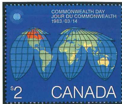
En el Día de la Commonwealth Canadá emitió este sello ilustrado con los países miembros y su distribución en el globo (1983).

Esta gran diversidad de apartados provoca que esta especialidad suela dividirse en dos ramas fundamentales (general y temática) y subdividirse en múltiples subtemas. Al iniciar una colección de este tipo es aconsejable hacer lo mismo y, por lo menos en un principio, dedicarse