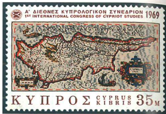
Los mapas antiguos constituyen la ilustración de esta serie emitida por Chipre en 1969 en el primer congreso internacional de estudios chipriotas.

En muchos casos, los matasellos, por su dibujo o texto, también amplían la colección.