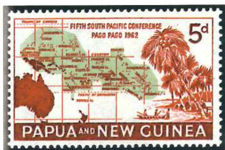
Sello de Papua Nueva Guinea de 1962 emitido en conmemoración de la V Conferencia del Pacífico Sur.

La cartografía es una especialidad filatélica que trata todo lo referido a mapas. Abarca, por tanto, un campo muy amplio: planos, cartas, mapas topográficos, etc.,