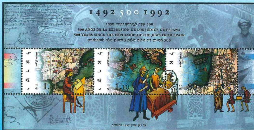
Sellos de Israel de 1992 ilustrados con mapas pertenecientes al atlas realizado por Abraham Cresques en el año 1375.

Cartógrafo mallorquín de origen hebreo, designado como el «maestro de mapamundis y brújulas», Abraham Cresques fue el autor del Atlas catalán de 1375 (hoy en la Biblioteca Nacional de París, por el regalo que le hizo el infante Juan al rey de Francia). Es, sin duda, la mejor obra cartográfica del medievo. Consta de seis pergaminos pegados sobre tablas: los